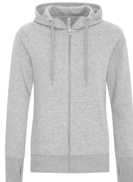
L2018 $63.80 LADIES' / FEMME XS-4XL