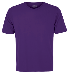
ATC8000 ADULT / ADULTE XS-4XL