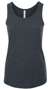
ATC8004L LADIES' / FEMME XS-4XL