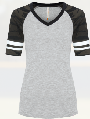
ATC0822L LADIES' / FEMME XS-4XL