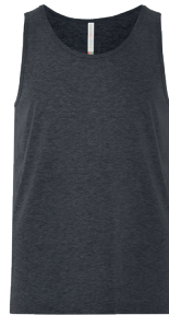
ATC8004 ADULT / ADULTE XS-4XL