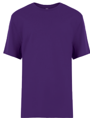
ATC8000Y YOUTH / JEUNE XS (2-4), S (6-8), M (10-12), L (14-16), XL (18-20)