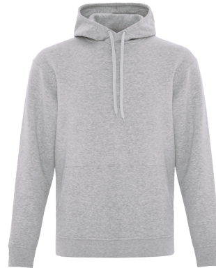
F2016 $59.98 ADULT / ADULTE XS-4XL