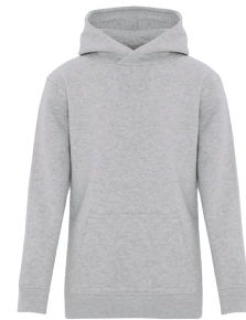
Y2016 $59.98 YOUTH / JEUNE S (6-8), M (10-12), L (14-16), XL (18-20)