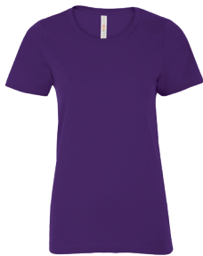
ATC8000L LADIES' / FEMME XS-4XL