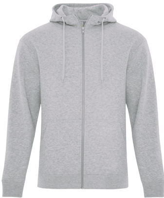
F2018 $63.80 ADULT / ADULTE XS-4XL