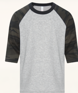
ATC0822Y YOUTH / JEUNE XS (2-4), S (6-8), M (10-12), L (14-16), XL (18-20)