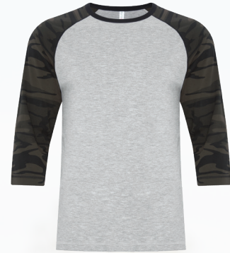
ATC0822 ADULT / ADULTE XS-4XL